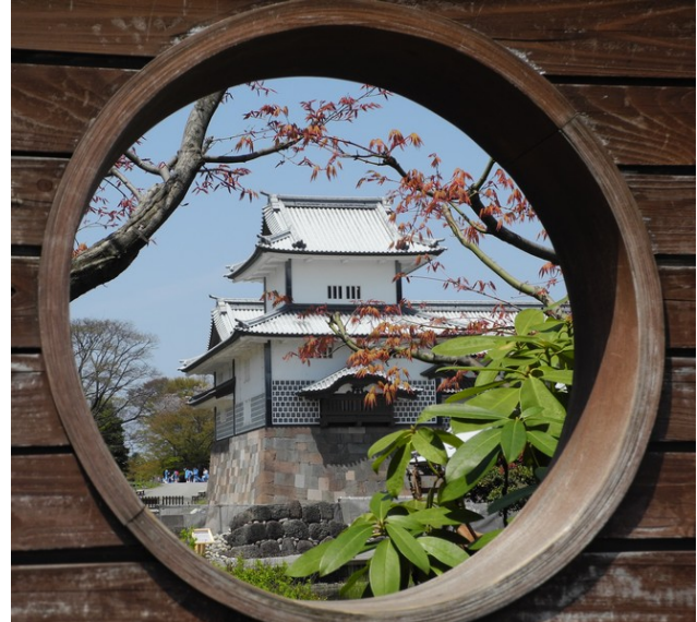
Fotos: Drachenwasserfall in Nikko, Gesa Neuert und Schloss in Kanazawa, Klaus Balzer

Abseits der Metropolen werden wir durch das ländliche Japan reisen und dabei die JDG Tochigi, die seit 2001 unsere Partnergesellschaft ist, besuchen. Gemeinsam wandern wir mit unseren japanischen Freunden auf alten Handelswegen und tauchen ein in die traditionelle Kultur Japans. Anlass der Reise ist eine Einladung der JDG Ishikawa, die speziell für die DJGen ein besonderes Begegnungs- und Besichtigungsprogramm ausgearbeitet hat.